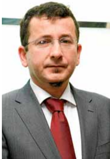
El presidente del Colegio Manuel Moñino.

La carencia de profesionales especializados en centros sanitarios y hospitales es la principal reivindicación del Colegio Oficial de Dietistas-Nutricionistas de Baleares (Codnib), creado en 2007 y del que forman parte 61 colegiados; la mayoría de Mallorca. Son diplomados y graduados universitarios en Nutrición Humana y Dietética, una profesión reciente en España –la primera promoción salió en 1991–, pero que en el resto de Europa y en Estados Unidos existe desde hace mucho tiempo. A los colegiados extranjeros se les exige la convalidación al título oficial español.