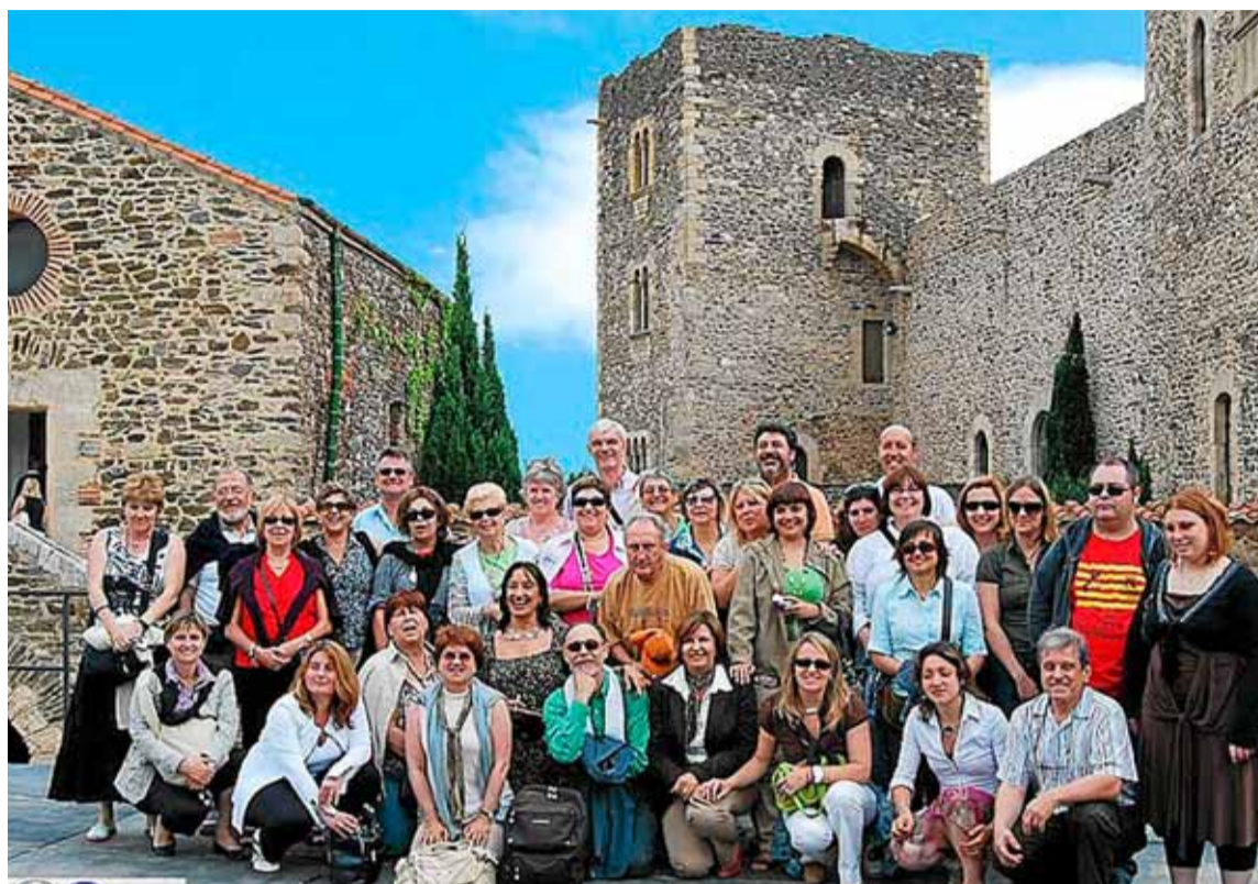
Numerosos asociados posando durante un viaje de compañerismo a Perpiñán.

Otra de las reivindicaciones de este colectivo es aclarar la confusión que existe en España entre los guías de turismo y los guías de acompañamiento, o guías de transferistas, cuya labor se limita a acompañar en los traslados a los turistas sin que, en ocasiones, medie palabra entre ellos. Algo por lo que lleva luchando desde hace cuatro años este Colegio Oficial. «En 2008 se intentó introducir en el grado de