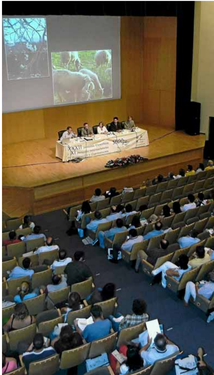
Numerosos profesionales asistiendo a unas jornadas formativas del Colegio.

Para conseguir las metas marcadas, el Colegio Oficial de Veterinarios de las Islas Baleares