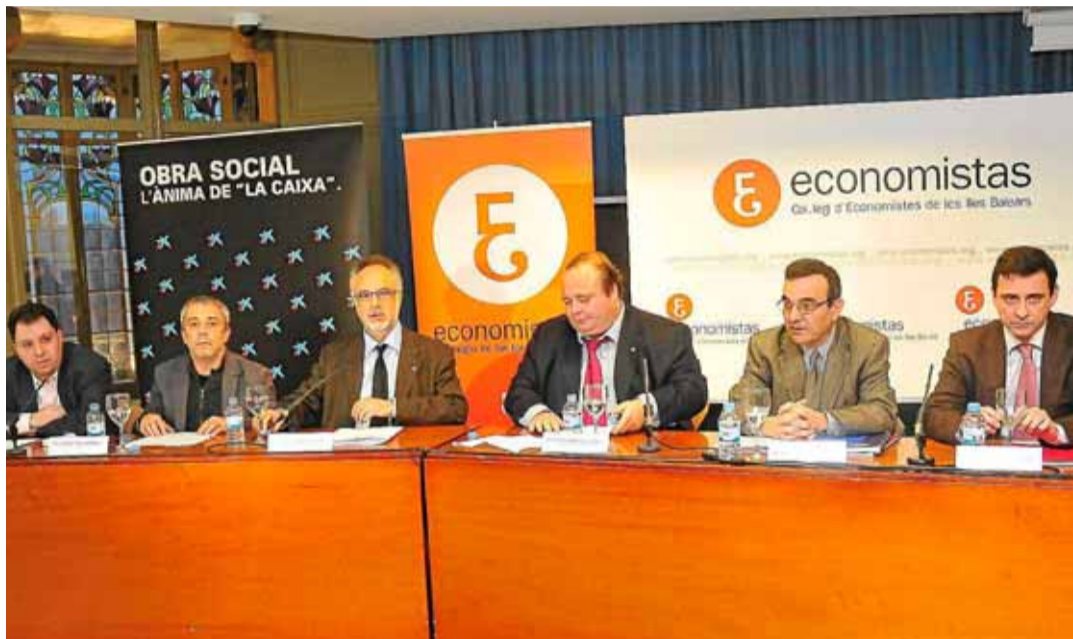
Integrantes de la charla organizada esta semana por el Colegio de Economistas sobre las políticas económicas de los partidos.

Japón es la tercera potencia mundial por debajo de China con una proyección internacional muy importante. El caos actual repercutirá sin duda en el PIB mundial, que podría bajar varios puntos, «aunque es pronto para hacer estimaciones porque aun se están evaluando los daños, se habla de un 1%». Las importaciones y exportaciones se resentirán y en la carrera por el liderazgo, China, actual segunda potencia mundial, «subirá más escalones» en su ascenso a primera potencia; «punto al que llegará en algo más de una década», vaticina el decano.