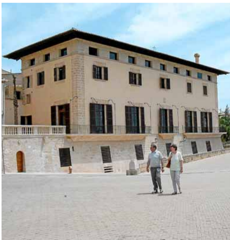
Ca la Torre, la sede del Colegio de Arquitectos.

El Coaib es una corporación de derecho público con personalidad jurídica propia y sus finalidades son todas aquellas relacionadas con la arquitectura, el urbanismo y la ordenación del territorio, el patrimonio arquitectónico y el medio ambiente, considerados como función social.