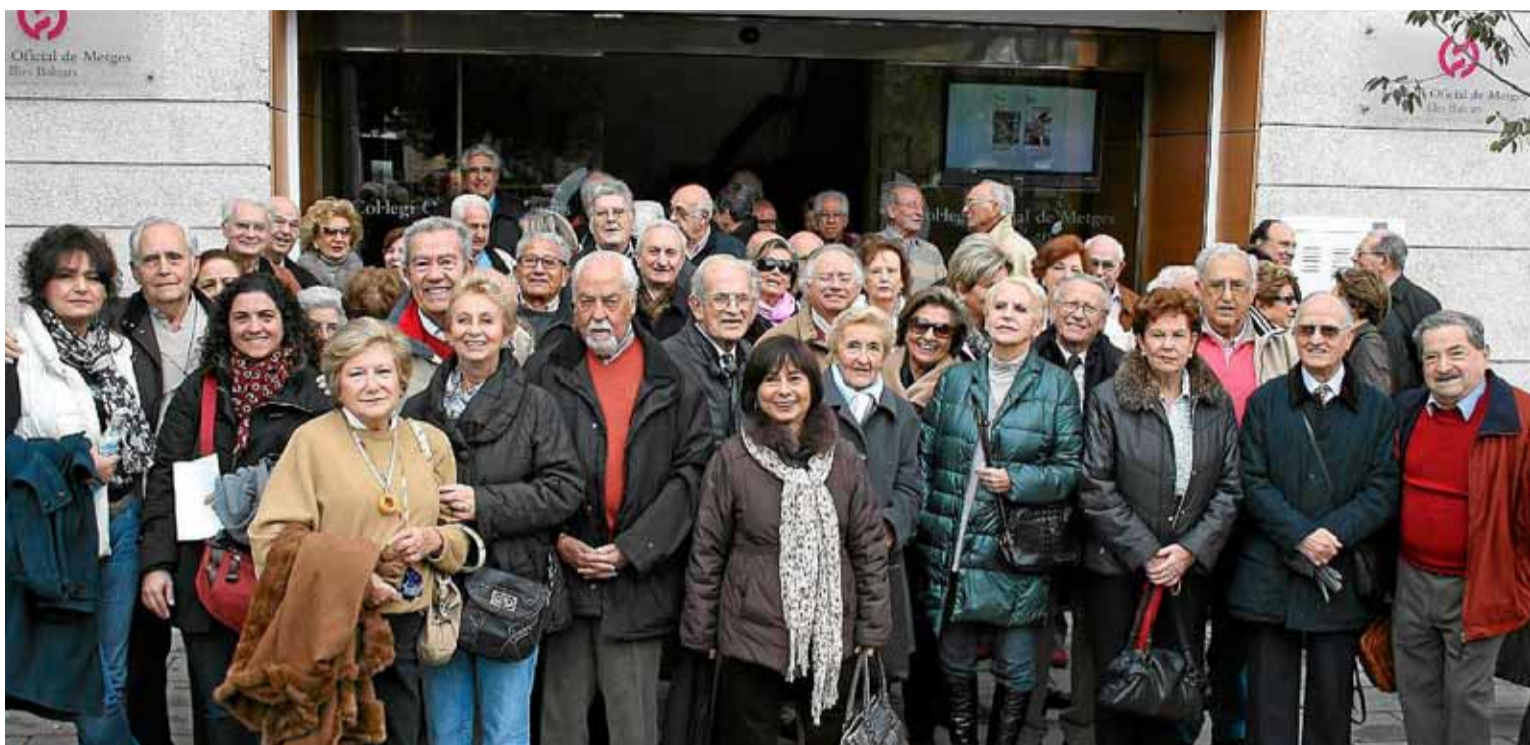
Colegiados a las puertas de la sede del Colegio Oficial de Médicos de Baleares, uno de los más antiguos de las Islas.